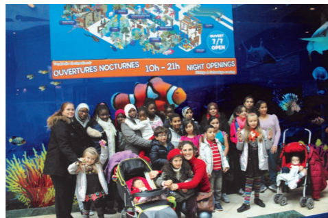
Sortie familiale à l'aquarium Sea Life