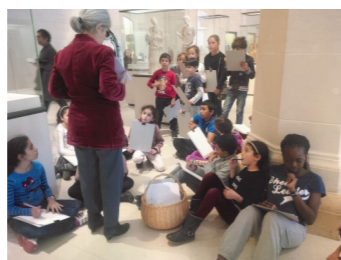
Sortie d'enfants au Petit Palais