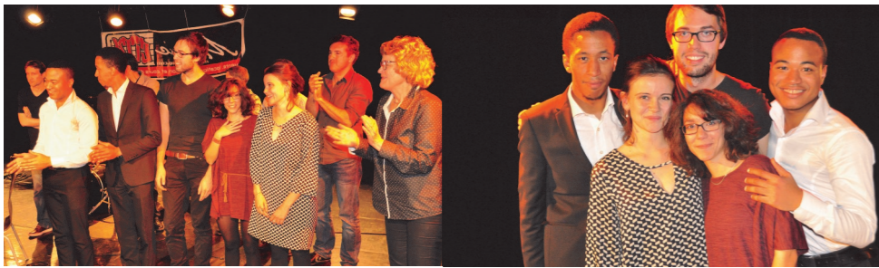
Margot la Nuit, les vainqueurs, avec la maire-adjointe Le groupe Margot la Nuit

Remise des prix aux gagnants et autres participants.