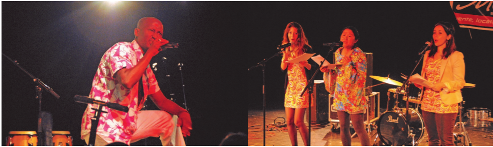
Del Castro Tu Quoque