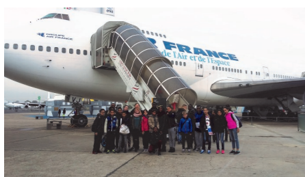
Sortie de jeunes au musée du Bourget

Informations et inscriptions auprès de Sylviane et Delphine