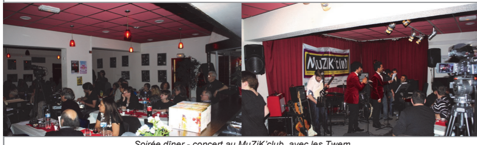
Soirée dîner - concert au MuZik'club, avec les Twem