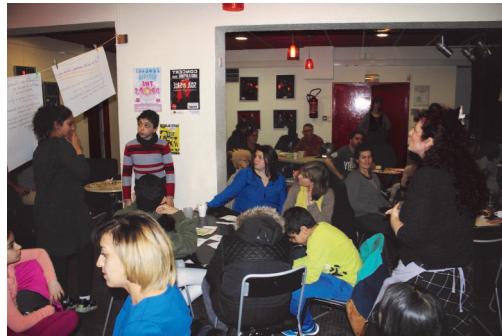
Conférence populaire organisée dans le cadre de la Quinzaine de la Parentalité

la réinsertion sociale des personnes les plus démunies, en facilitant leur accès à la culture, aux sports et aux loisirs : jeudi 10 mars de 14h à 16h dans le hall de la MJC.