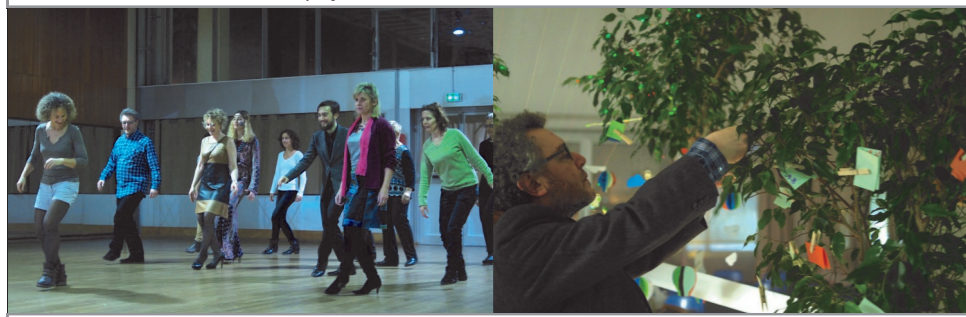
Soirée interactive théâtre - art visuel