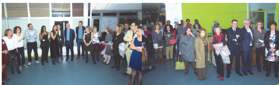
Discours de bienvenue dans le hall