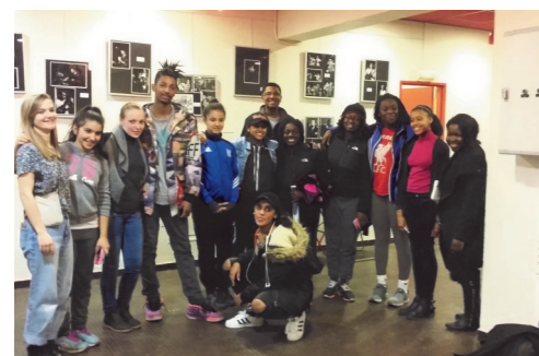
Délégation de jeunes américains reçus à la MJC pendant les vacances de février

Renseignements et inscriptions auprès de Sylviane et Delphine au 01 48 99 75 40