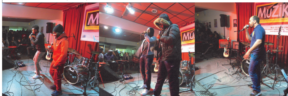
GLOIRE GLACTIKS & DINO (au fond)