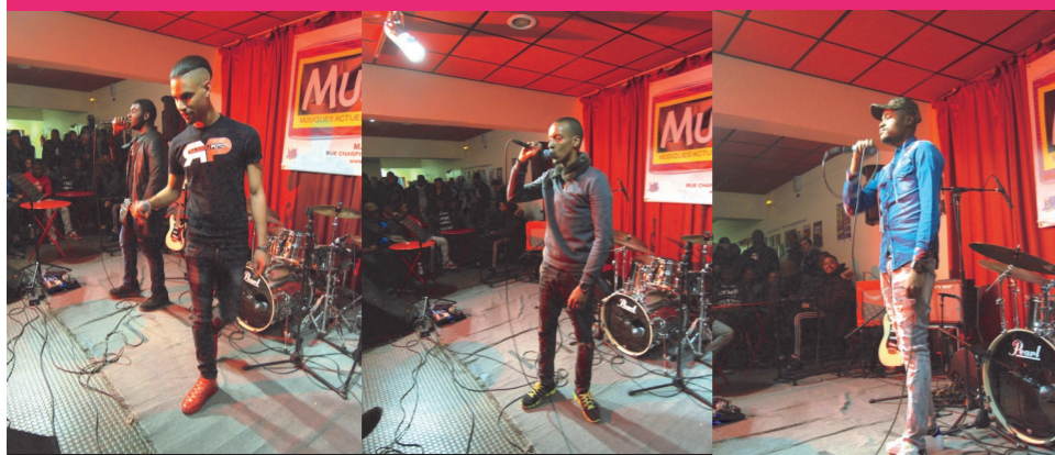
RYL'S & DOUKS (au fond)