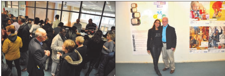
VUE DU PUBLIC