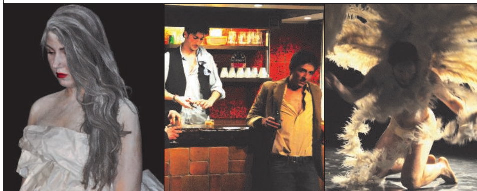
LES HÉROS PÉRIMÉS