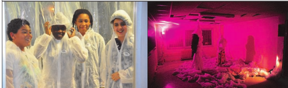
LA FONTE DES GLACES, AVEC LES COLLÉGIENS D'ISSAURAT

« Denrées périssables », soirée mise en scène par le Lieu Exact (extraits)