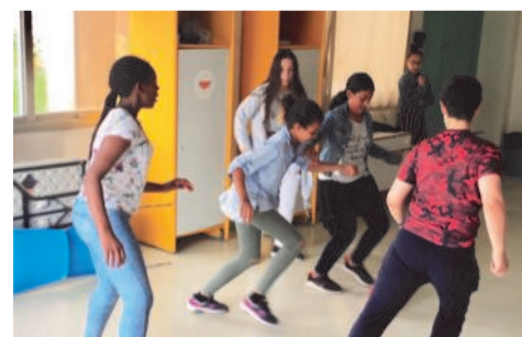
Les participants se sont pris au jeu et se sont bien amusés !