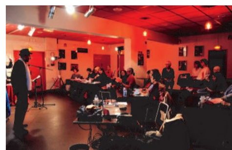
Une soirée ludique où chacun est amené à interagir avec les autres !