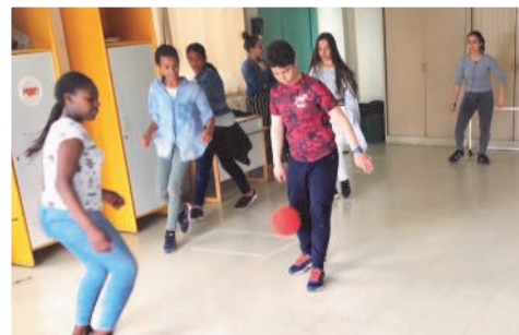
L'atelier « Invente ton mini terrain de foot », s'est tenu dans le cadre de la préparation de Jour de Fête