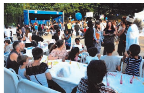
Dans les jardins de l'hôtel de Ville : spectacles (Le Lieu Exact) et convivialité !

L'Accueil Loisirs : mois de juillet 2018