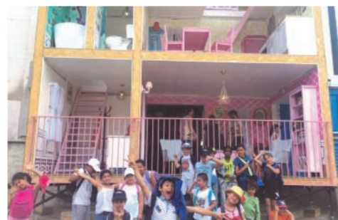
Sortie des jeunes pour un après-midi « Sauv'nag » Les enfants en visite au Palais de Tokyo (Paris)