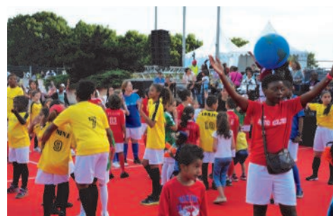
La thématique du football a été largement représentée par la MJC Club ici sur la dalle de la mairie