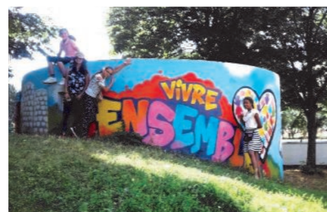
Visite au château de Versailles pour petits et grands Sur les traces du 'Street Art' à Créteil