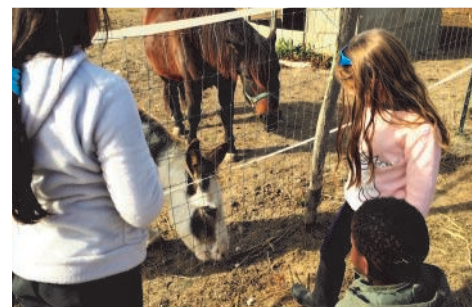
Sortie avec le CS Kennedy et Les Paniers de Créteil