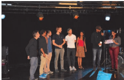
3ème prix : Sysyphus