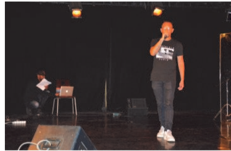
2ème prix : Sifa