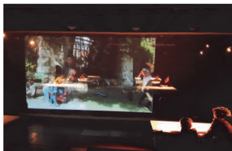
«Nous ne sommes pas d'ici !», par le Lieu Exact