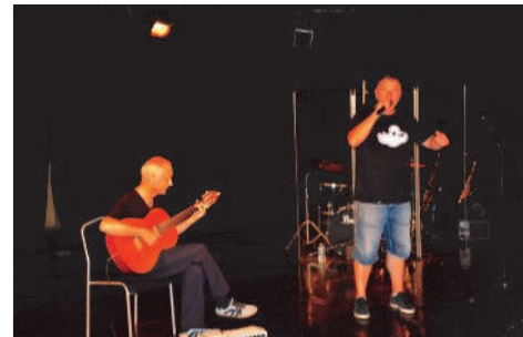
4ème prix : Hadilovend

Mois de la Parentalité : 23 - 25 - 26 octobre 2018