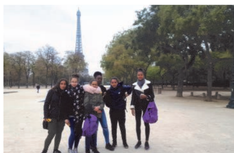
Rallye photo à Paris