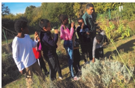
Animation écologique à Choisy-le-Roi