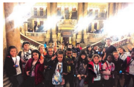
Visite de l'Opéra Garnier