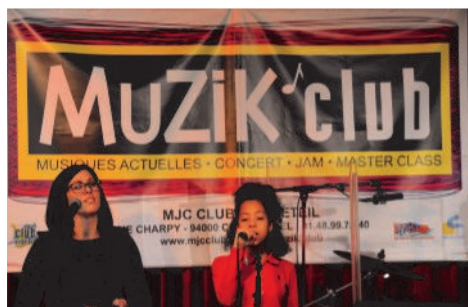
Atelier chant de la MJC Club