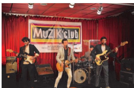
'Concert de Seven Ages', groupe Brit-Pop Rock