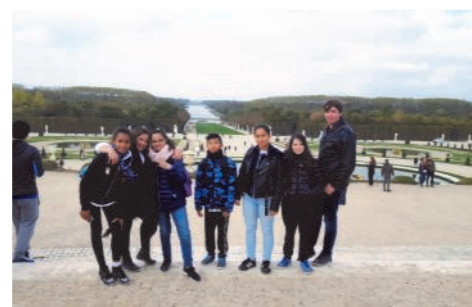
Visite du Château de Versailles