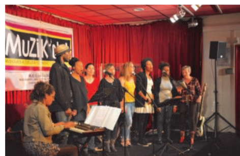
Atelier chant du Conservatoire de Limeil-Brevannes