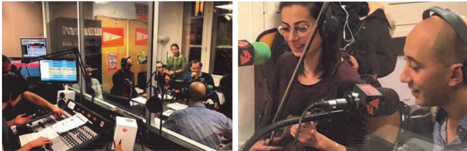
L'équipe de Radio Club de Créteil s'initie au direct à partir de Radio Campus Paris

Emission en direct de Radio Campus : samedi 12 janvier 2019