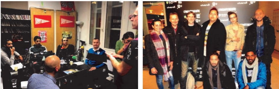
La formation est assurée par « L'Œil à l'écoute », partenaire de la MJC Club

Théâtre au Cœur de l'Hiver : samedi 12 janvier 2019