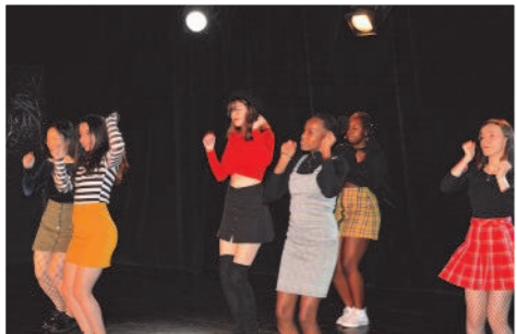
Spectacle de l'atelier danse K-Pop de la MJC, dans la salle de théâtre

Fête de Noël : mercredi 19 décembre 2018