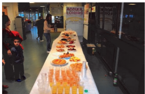
Goûter participatif dans le hall de la MJC