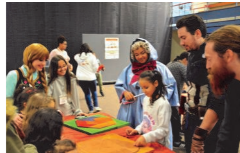
Animation des cosplayers sur le stand Cariboo

Fête de Noël : mercredi 19 décembre 2018