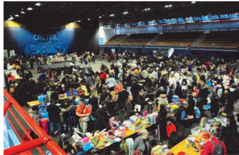
Vue de la salle vers midi

Foire aux Jeux et Jouets : dimanche 9 décembre 2018