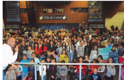
Photo de groupe à la fin