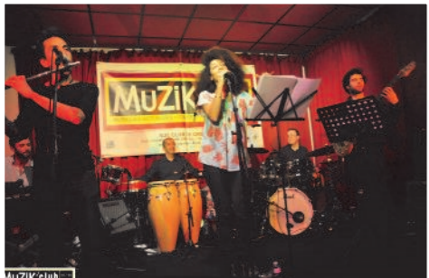
Concert du groupe Bazar Sawan

MuZiK'club - Musiques du monde : samedi 16 février 2019