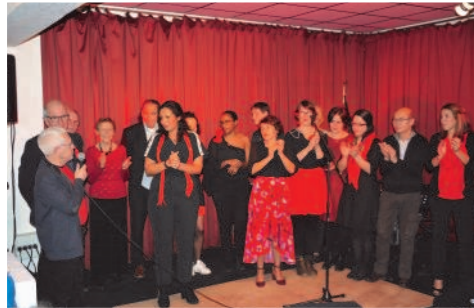
Le discours de bienvenue

Soirée des adhérents : samedi 26 janvier 2019