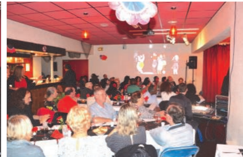
Le repas des adhérents