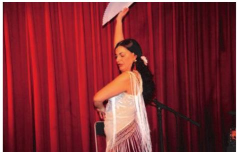
Flamenco par la cie « Le peuple danseur »