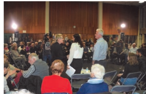
La présentation des participants

Vacances de février : Accueil Loisirs et Salon Familial