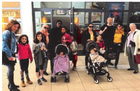
Sortie familiale au cinéma du Palais