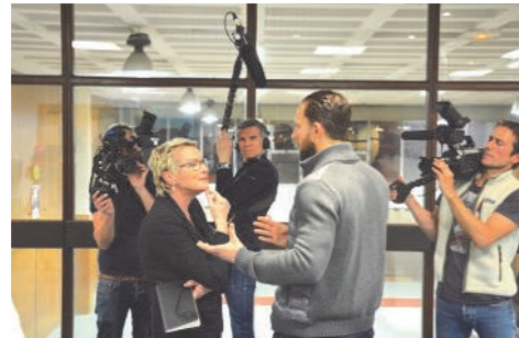
Interviews réalisées par France 2