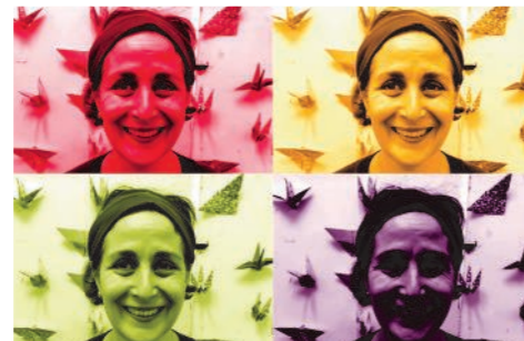
Portraits de femmes façon « Andy Warhol »