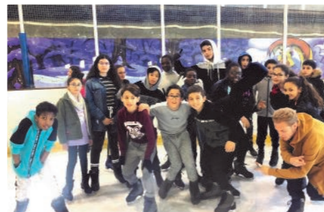
Sport - loisir pour les jeunes à la patinoire