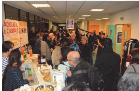
L'accueil des participants