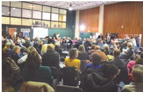
Vue générale de la salle du débat