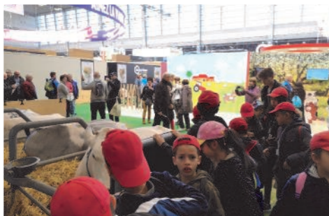
Visite des enfants au salon de l'agriculture

Vacances de février : Accueil Loisirs et Salon Familial