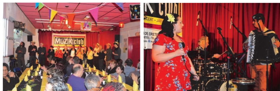
Les vœux du CA et de l'équipe de la MJC