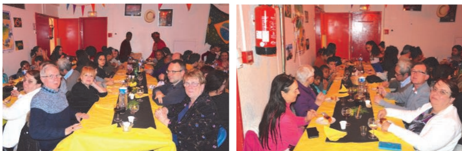
Les adhérents ont pu apprécier en musique le repas préparé par l'association Entre-Parents