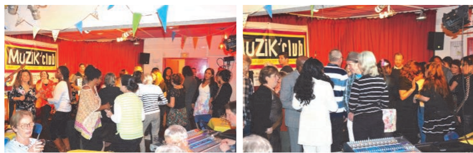
Après le repas, les participants se sont laissés entrainer dans la danse au rythme du forró brésilien