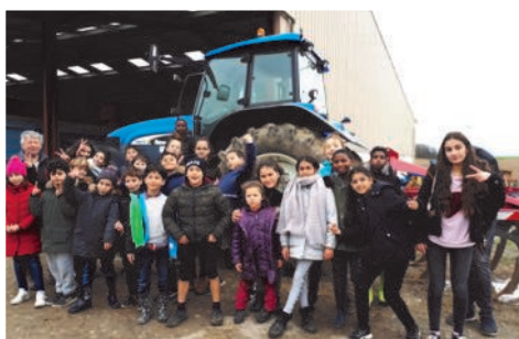
à la ferme...