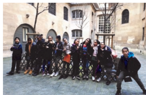
Sortie à la Conciergerie...