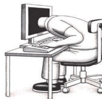
CASSEURS DE PBE (Créteil - Rue Steno)

A cette occasion, la MJC Club proposera aux élèves de l'école Chateaubriand des activités de découverte comme alternative aux écrans.