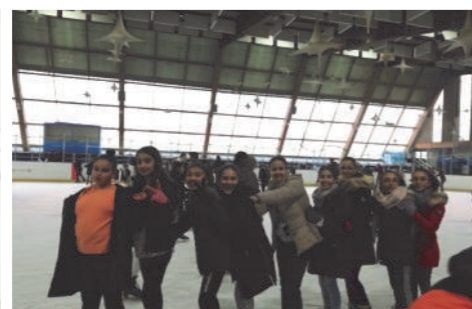
à la patinoire...