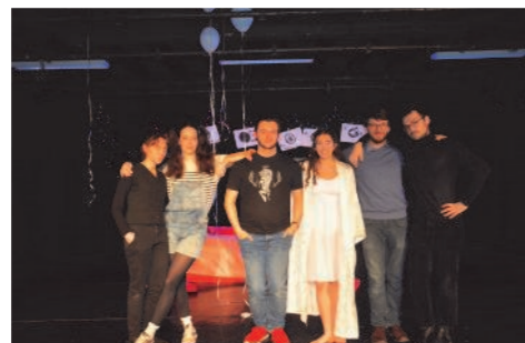
« Le Journal de Grosse Patate », par la cie Les Plusieurs Vies, a été très apprécié du public