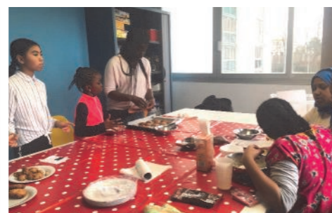
Atelier « cookies »