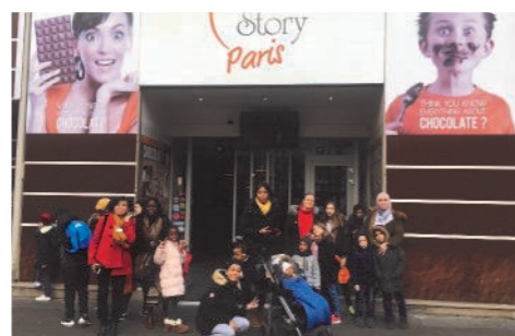
au musée du chocolat