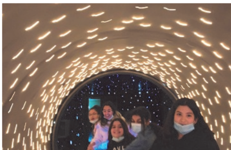
Sortie cinéma au Grand Rex avec aussi une activité « escape game »