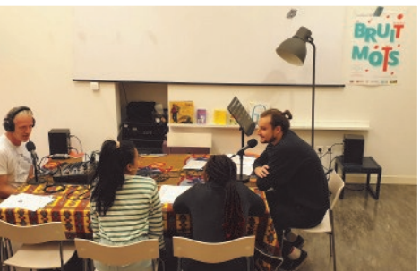
Plateau radio avec des auteurs invités du festival et une éditrice