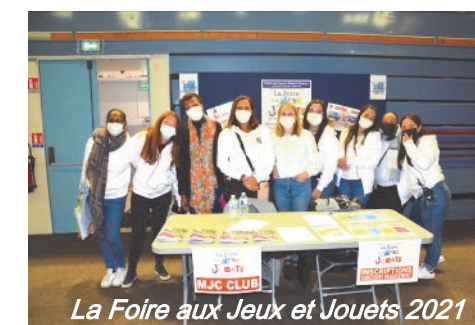
La Foire aux Jeux et Jouets 2021

Evidemment, la mise en place du Pass Sanitaire, décrit par certains, a permis ce retour à une vie sociale et culturelle (voir la photo ci-dessous), au-delà de toutes polémiques.