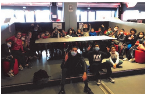
Sortie cinéma au Grand Rex avec aussi une activité « escape game »