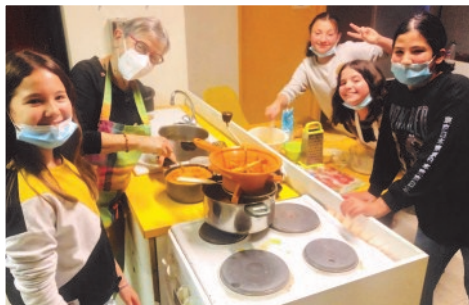
A vos fourneaux !