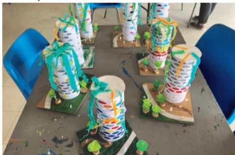
Maquettes des choux réalisés par les enfants