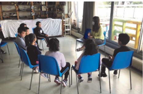
Atelier '50 ans des choux'