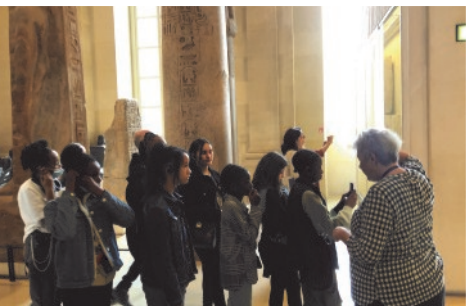
Sortie au musée du Louvre