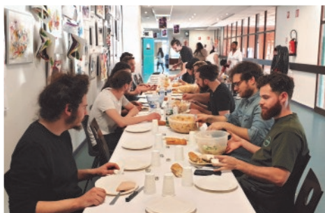
Repas convivial avant les qualifications