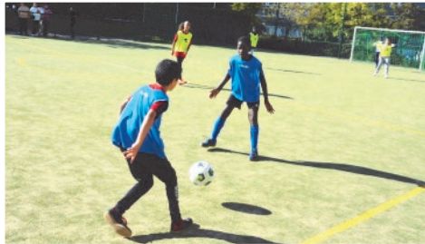
Challenge sportif Bernard Marguerie, organisé par les Conseils de Quartier du Secteur Ouest