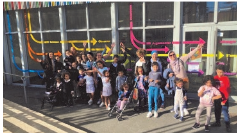
Les familles en activité pendant les vacances de la Toussaint (Exploradôme, atelier créatif)