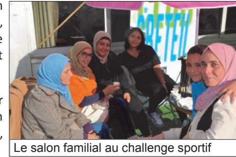
Le salon familial au challenge sportif

• ATELIER CUISINE : dans le cadre de la préparation du MuZiK'club du samedi 19 novembre (voir page 4), un atelier cuisine sera organisé à partir de 14h30. Les préparations culinaires seront vendues sur place pendant la soirée.