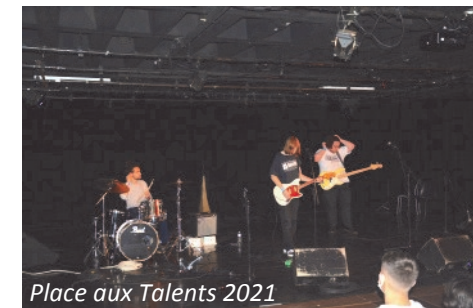
Place aux Talents 2021

Ce mois-ci, la MJC Club propose une programmation culturelle diversifiée, en commençant par un premier MuZik'club , scène de musiques actuelles, consacré au Mexique, samedi 19 novembre et en enchaînant par le tremplin musical Place aux Talents , organisé par le Conseil de Quartier N°5. Sans oublier la présentation d'un spectacle jeune public , proposé par les Médiathèques de Créteil, dans la salle théâtre de la MJC.