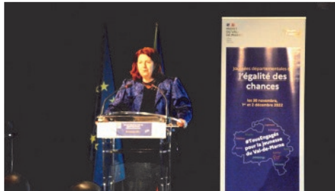
Discours du maire et de la préfète à la cérémonie d'ouverture de la journée de l'égalité des chances (voir édito)