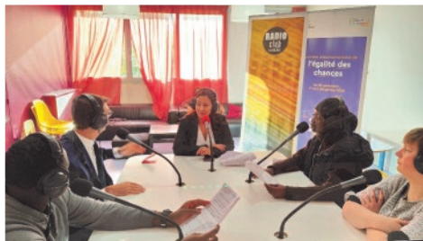
Emission de radio avec le préfet délégué à l'égalité des chances, la directrice de la MJC et des jeunes de l'AFPA