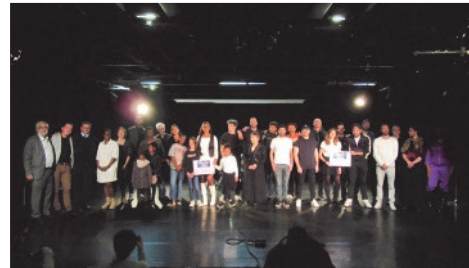
Place aux Talents organisé par le Conseil de Quartier n°5, avec la MPT HAM et la MJC Club