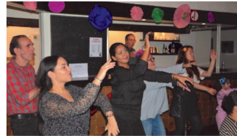
Concert de musique mexicaine - Los Gringos Paname - au Muzik'club samedi 19 novembre