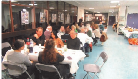
Le verre de l'amitié avec les participants, suivi du repas organisé par le Conseil de quartier