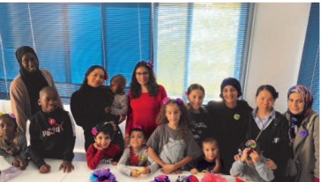
Au Salon Familial de la MJC