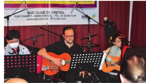
Les élèves des cours de batterie et guitare avec leurs professeurs, en 1ère partie