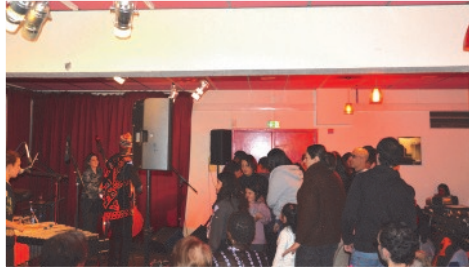
Une soirée bien remplie, qui s'est achevée pour certains sur la piste de danse ...