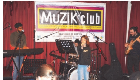
Accompagnement à la trompette et performance d'une jeune élève de chant