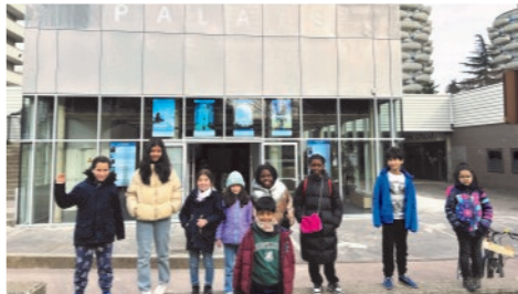
Réouverture des cinémas du Palais