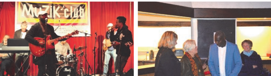
Une jam riche et diversifiée