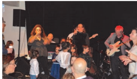
Soirée animée par un groupe de musique