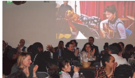
aux adhérents et invités présents