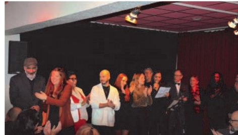
... et de l'équipe de la MJC Club ...