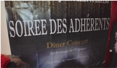
En première partie : présentation des vœux du Conseil d'administration et ...