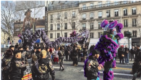
Défilé du nouvel an lunaire à Paris