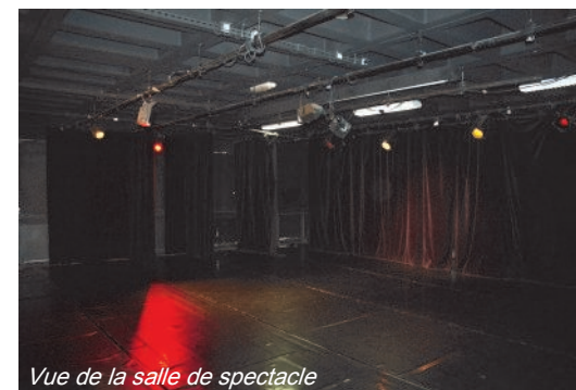
Vue de la salle de spectacle