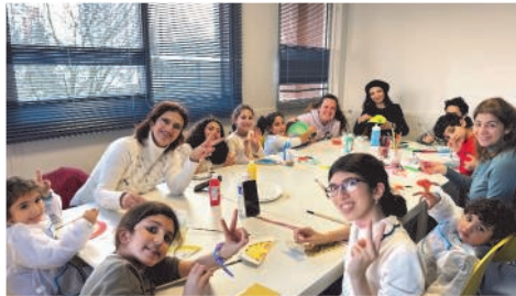
Atelier créatif sur le thème du carnaval