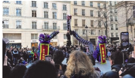
L'année du dragon !