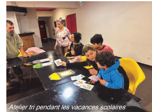
Atelier tri pendant les vacances scolaires