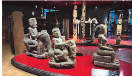
« L'éveil des sens » !