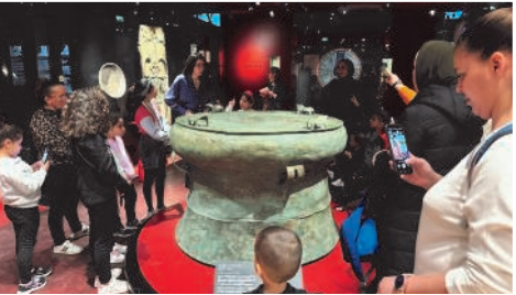
Visite guidée du musée du quai Branly