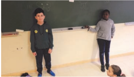
Jeux de connaissances