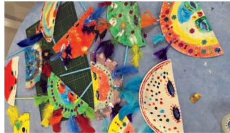
Réalisation de masques